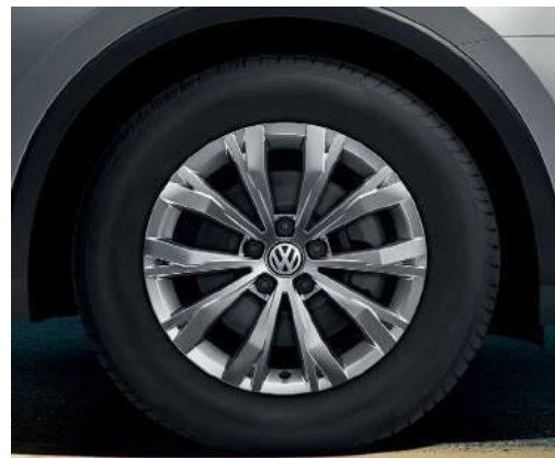
Montana 7J x 17