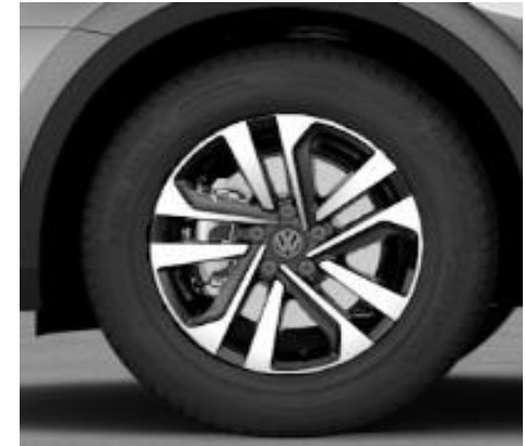
Dublin 7J x 17