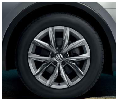
Kingston 7J x 18