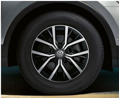
Tulsa 7J x 17