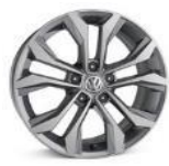
Легкосплавные колесные диски "Soho" 7J x 17 стандартно для Exclusive 2.0L