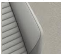
Комбинированная обивка сидений из искусственной замши/кожи светло-серого цвета