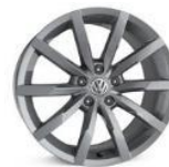
Легкосплавные колесные диски "Monterey" 8J x 18