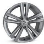
Легкосплавные колесные диски "Sebring" 7J x 17