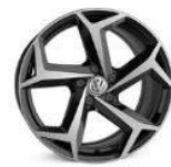
Легкосплавные колесные диски "Bonneville" 8J x 18