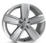
Легкосплавные колесные диски "Istanbul" 7J x 17 стандартно для Business 2.0L