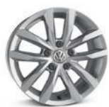
Легкосплавные колесные диски "Sepang" 6,5 J x 16 стандартно для Business 1.4L